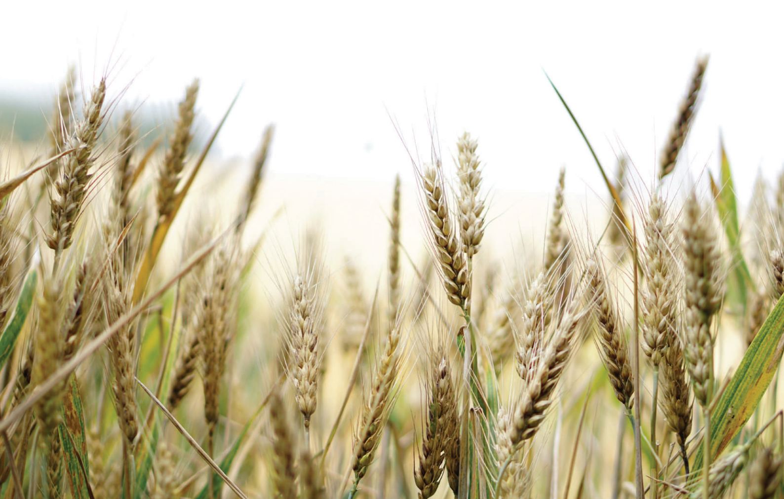
Varga Ákos a vállalkozás vezetője